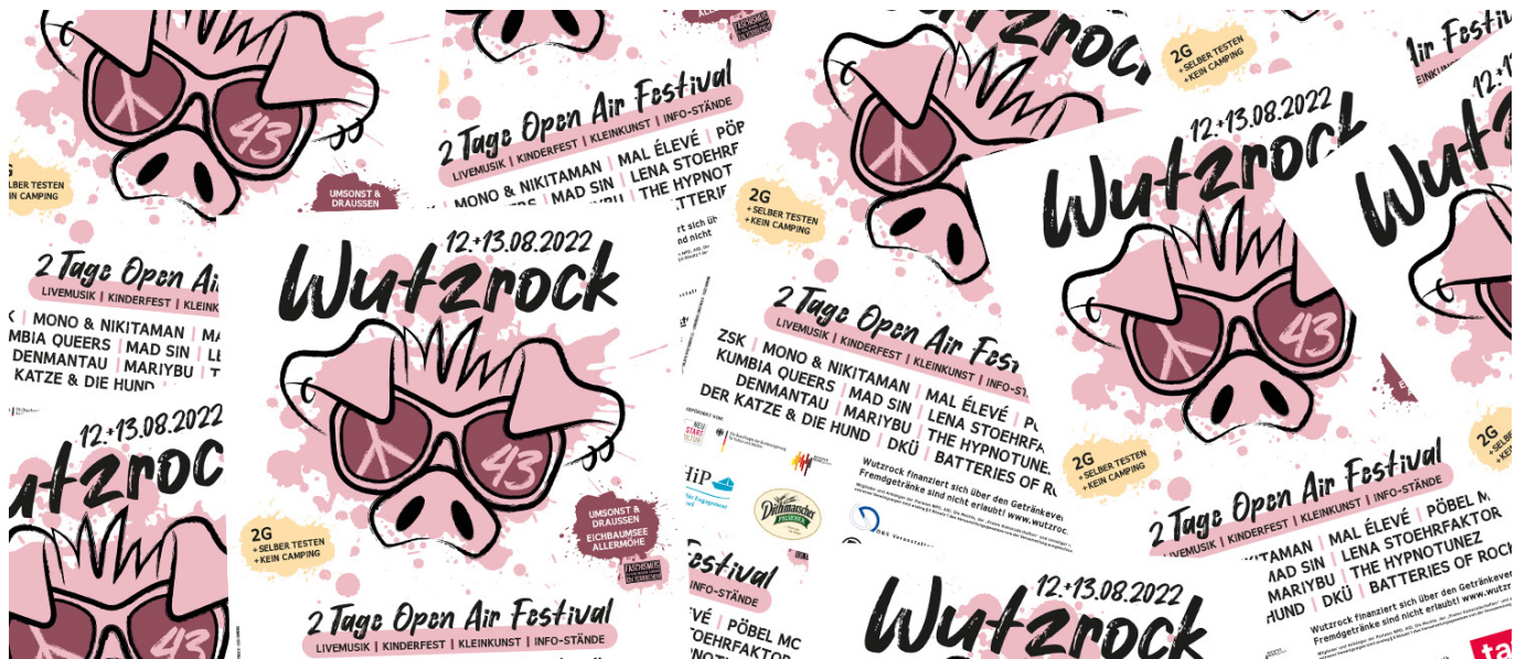
Flyer- und Plakatdesign von Nicole Howe

Die Plakate und Flyer für das 43. Wutzrock Festival sind frisch eingetroffen und werden in den nächsten Wochen öffentlich sowie in kulturellen und sozialen Einrichtungen aufgehängt und ausgelegt.